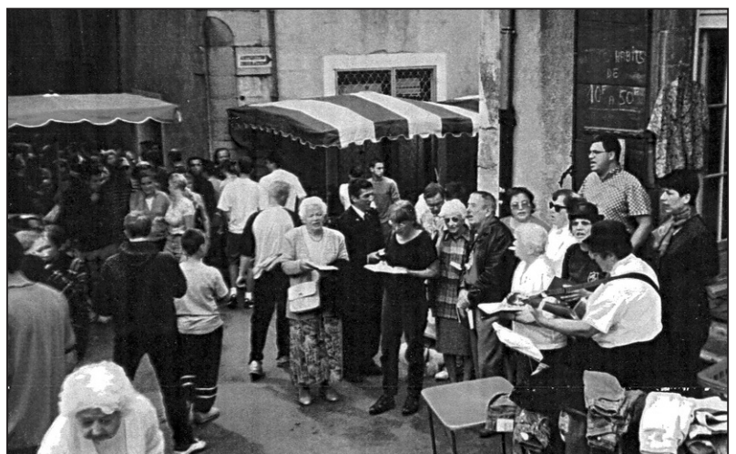
Zingen op straat in Anduze

In het algemeen willen we het belang onderstrepen om in het buitenland op zondag een kerkdienst bij te wonen. Dat is in Frankrijk niet zo eenvoudig vanwege de taalbarrière. Toch kan het kerkbezoek van gasten uit het buitenland voor onze Franse broeders en zuster veel betekenen. We wijzen u nog eens op de mogelijkheid om onze stichting een lijst op te vragen van adressen van de kerken van de Union des Eglises Réformées Évangéliques Indépendantes waar wij als kerken nauw contact mee onderhouden. Daarop staan tevens de aanvangstijden van de kerkdiensten vermeld.